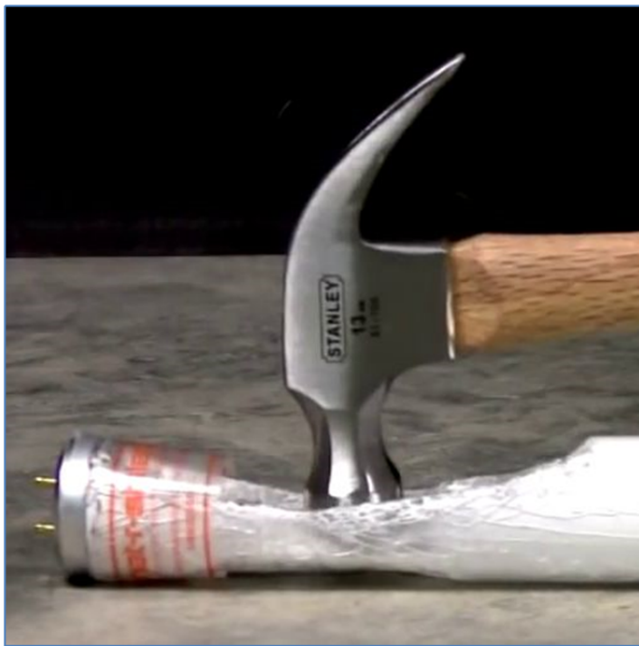
Retención de vidrio por bombilla fluorescente de Seguridad

Si bien hay más de un polímero utilizado para la protección de las bombillas, solo un material específico es transparente a las frecuencias UVa producidas por las bombillas diseñadas para la atracción de insectos, y toda la gama de Tubos UV enfundados Electrosect de Brandenburg utiliza este material.